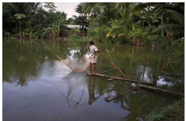
ໜອງເລກທີ ບ້ານ Village ເຈົ້າຂອງໜອງ Propriétaire ເນື້ອທີ່ Surface ທຶນາຂອງນ້ຳ Alimentation hydraulique ກິດຈະກຳ Usages Mare n° 180 ວິຊຸນ VIXUN ສິງທອງ Singthong 3774 m 2 B 1 - 2