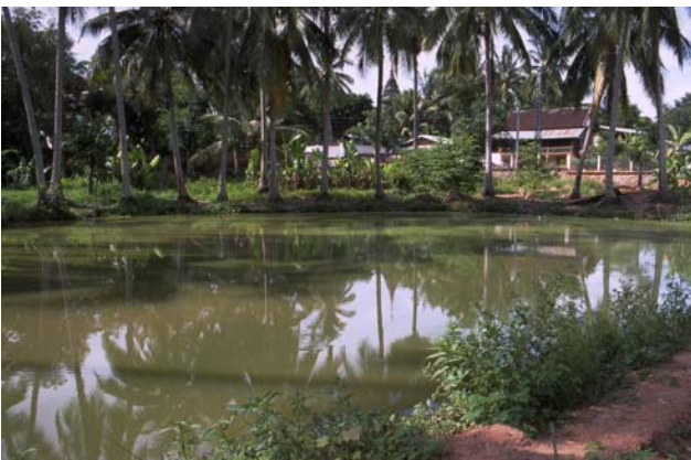
ໜອງເລກທີ ບ້ານ Village ເຈົ້າຂອງໜອງ Propriétaire ເນື້ອທີ່ Surface ທຶນາຂອງນ້ຳ Alimentation hydraulique ກິດຈະກຳ Usages Mare n° 29 ທາດຫຼວງ THAT LUANG ຊິງກວາງ Singkouang 1152 m 2 A 5