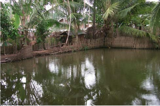
ໜອງເລກທີ ບ້ານ Village ເຈົ້າຂອງໜອງ Propriétaire ເນື້ອທີ່ Surface ທຶນາຂອງນ້ຳ Alimentation hydraulique ກິດຈະກຳ Usages Mare n° 25 ທາດຫຼວງ THAT LUANG ປາວ Pao 50 m 2 B 1