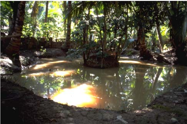
ໜອງເລກທີ ບ້ານ Village ເຈົ້າຂອງໜອງ Propriétaire ເນື້ອທີ່ Surface ທຶນາຂອງນ້ຳ Alimentation hydraulique ກິດຈະກຳ Usages Mare n° 129 ມະໂນ MANO ວົງ Vong 113 m 2 A 5