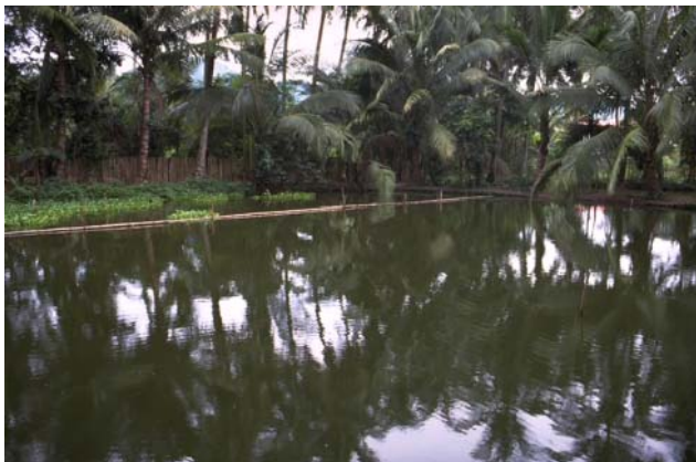
ໜອງເລກທີ ບ້ານ Village ເຈົ້າຂອງໜອງ Propriétaire ເນື້ອທີ່ Surface ທຶນາຂອງນ້ຳ Alimentation hydraulique ກິດຈະກຳ Usages Mare n° 67 ມະໂນ MANO ຊຽງຈັນ Xieng Chanh 1375 m 2 A 1 - 3