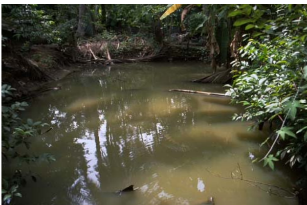
ໜອງເລກທີ ບ້ານ Village ເຈົ້າຂອງໜອງ Propriétaire ເນື້ອທີ່ Surface ທຶນາຂອງນ້ຳ Alimentation hydraulique ກິດຈະກຳ Usages Mare n° 179 ໝື່ນນາ MEUNA ປິນແກ້ວ PinKeo 69 m 2 B 1