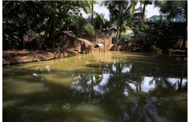
ໜອງເລກທີ ບ້ານ Village ເຈົ້າຂອງໜອງ Propriétaire ເນື້ອທີ່ Surface ທຶນາຂອງນ້ຳ Alimentation hydraulique ກິດຈະກຳ Usages Mare n° 146 ນາວຽງຄຳ NAVIENGKHAM ບຸນທັນ Bounthan 99 m 2 B 1