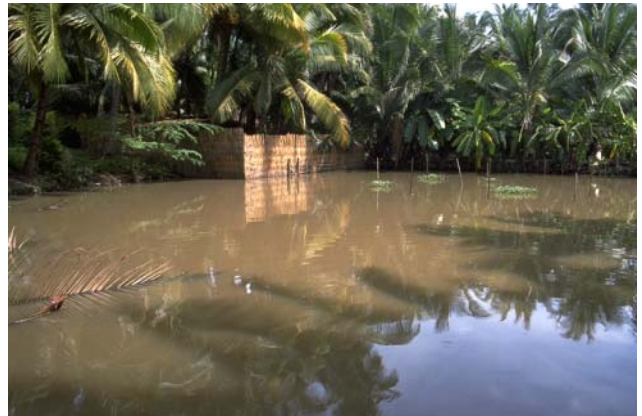
ໜອງເລກທີ ບ້ານ Village ເຈົ້າຂອງໜອງ Propriétaire ເນື້ອທີ່ Surface ທຶນາຂອງນ້ຳ Alimentation hydraulique ກິດຈະກຳ Usages Mare n° 52 ວິຂຸນ VIXUN ຈັນທິ Chantry 1323 m 2 B 1 - 2