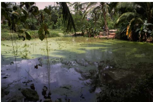
ໜອງເລກທີ ບ້ານ Village ເຈົ້າຂອງໜອງ Propriétaire ເນື້ອທີ່ Surface ທຶນາຂອງນ້ຳ Alimentation hydraulique ກິດຈະກຳ Usages Mare n° 69 ມະໂນ MANO ທອງວັນ Thongvanh 541 m 2 A 5