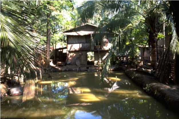
ໜອງເລກທີ ບ້ານ Village ເຈົ້າຂອງໜອງ Propriétaire ເນື້ອທີ່ Surface ທຶນາຂອງນ້ຳ Alimentation hydraulique ກິດຈະກຳ Usages Mare n° 127 ມະໂນ MANO ເດັ່ນໂຊ Déngxay 67 m 2 A 1