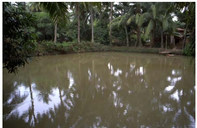
ໜອງເລກທີ Mare n° ບ້ານ Village ເຈົ້າຂອງໜອງ Propriétaire ເນື້ອທີ່ Surface ທຶນາຂອງນ້ຳ Alimentation hydraulique ກິດຈະກຳ Usages 66 ມະໂນ MANO ສຸພາພອນ Souphaphone 1063 m 2 A 1