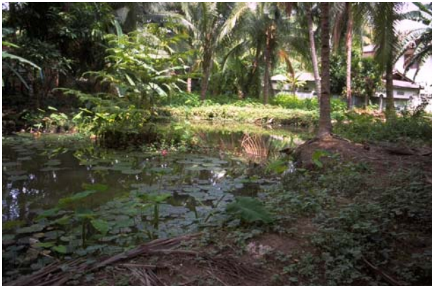
ໜອງເລກທີ ບ້ານ Village ເຈົ້າຂອງໜອງ Propriétaire ເນື້ອທີ່ Surface ທຶນາຂອງນ້ຳ Alimentation hydraulique ກິດຈະກຳ Usages Mare n° 177 ວິຊຸນ VIXUN ເຜິ້ງ Phéng 325 m 2 B 1 - 2