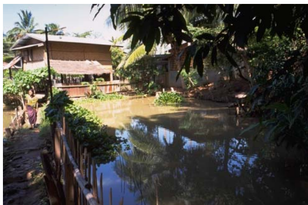
ໜອງເລກທີ Mare n° ບ້ານ Village ເຈົ້າຂອງໜອງ Propriétaire ເນື້ອທີ່ Surface ສົມມາຂອງນ້ຳ Alimentation hydraulique ກິດຈະກຳ Usages 114 ວຽງໄຊ VIENG XAY ພໍ່ເຖົ້າ ສ້າ Phothao cha 485 m 2 C 1 - 2