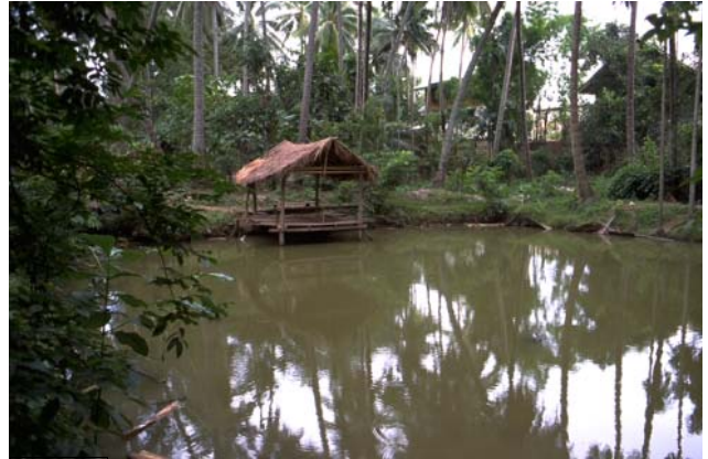
ໜອງເລກທີ Mare n° ບ້ານ Village ເຈົ້າຂອງໜອງ Propriétaire ເນື້ອທີ່ Surface ທຶນາຂອງນ້ຳ Alimentation hydraulique ກິດຈະກຳ Usages 62 ມະໂນ MANO ເຜິ້ງ Pheng 351 m 2 A 1