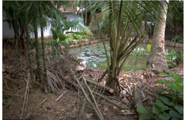
ໜອງເລກທີ ບ້ານ Village ເຈົ້າຂອງໜອງ Propriétaire ເນື້ອທີ່ Surface ທຶນາຂອງນ້ຳ Alimentation hydraulique ກິດຈະກຳ Usages Mare n° 176 ວິຊຸນ VIXUN ນາງ Nang 55 m 2 A 1 - 4