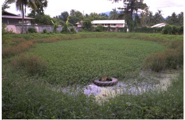
ໜອງເລກທີ ບ້ານ Village ເຈົ້າຂອງໜອງ Propriétaire ເນື້ອທີ່ Surface ທຶນາຂອງນ້ຳ Alimentation hydraulique ກິດຈະກຳ Usages Mare n° 26 ທາດຫຼວງ THAT LUANG ກຳ Kam 947 m 2 B 5