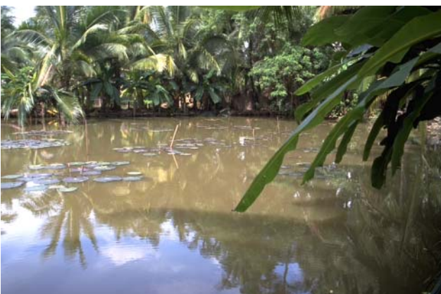
ໜອງເລກທີ ບ້ານ Village ເຈົ້າຂອງໜອງ Propriétaire ເນື້ອທີ່ Surface ທຶນາຂອງນ້ຳ Alimentation hydraulique ກິດຈະກຳ Usages Mare n° 53 ວິຂຸນ VIXUN ເຊ Xé 1701 m 2 B 1 - 2