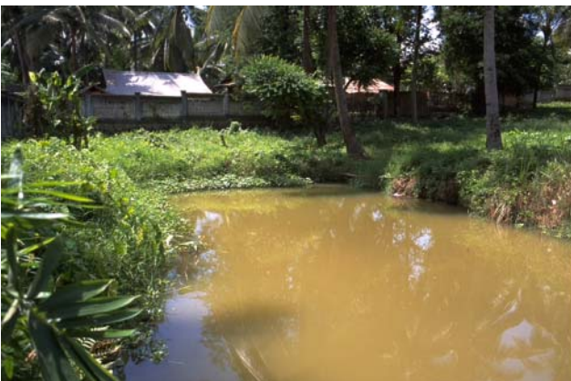
ໜອງເລກທີ ບ້ານ Village ເຈົ້າຂອງໜອງ Propriétaire ເນື້ອທີ່ Surface ທຶນາຂອງນ້ຳ Alimentation hydraulique ກິດຈະກຳ Usages Mare n° 149 ປ້ອງຄຳ PONGKHAM ຄຳເພັງ Khampheng 176 m 2 A 5