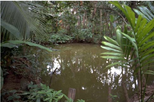
ໜອງເລກທີ Mare n° ບ້ານ Village ເຈົ້າຂອງໜອງ Propriétaire ເນື້ອທີ່ Surface ທຶນາຂອງນ້ຳ Alimentation hydraulique ກິດຈະກຳ Usages 63 ມະໂນ MANO ຍອດ Gnot 171 m 2 A 1