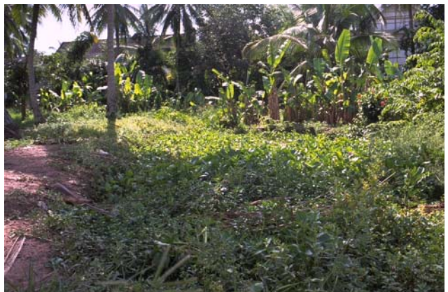
ໜອງເລກທີ ບ້ານ Village ເຈົ້າຂອງໜອງ Propriétaire ເນື້ອທີ່ Surface ທຶນາຂອງນ້ຳ Alimentation hydraulique ກິດຈະກຳ Usages Mare n° 30 ທາດຫຼວງ THAT LUANG ຊິງກວາງ Singkouang 134 m 2 A 5