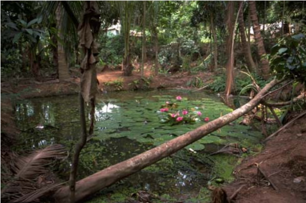
ໜອງເລກທີ ບ້ານ Village ເຈົ້າຂອງໜອງ Propriétaire ເນື້ອທີ່ Surface ທຶນາຂອງນ້ຳ Alimentation hydraulique ກິດຈະກຳ Usages Mare n° 19 ທາດຫຼວງ THAT LUANG ທິດຫຼ້າ Thit La 45 m 2 B 1 - 4