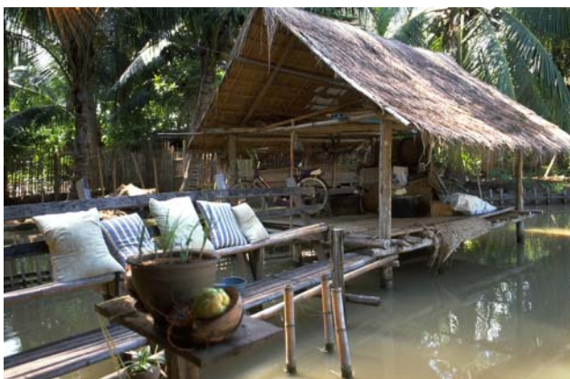
ໜອງເລກທີ Mare n° ບ້ານ Village ເຈົ້າຂອງໜອງ Propriétaire ເນື້ອທີ່ Surface ສົມມາຂອງນ້ຳ Alimentation hydraulique ກິດຈະກຳ Usages 111 ວຽງໄຊ VIENG XAY ຄຳຜອງ Khampong 485 m 2 C 1 - 2