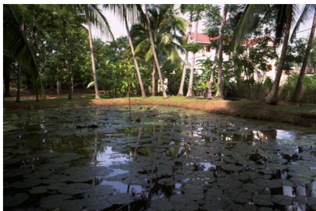
ໜອງເລກທີ ບ້ານ Village ເຈົ້າຂອງໜອງ Propriétaire ເນື້ອທີ່ Surface ທຶນາຂອງນ້ຳ Alimentation hydraulique ກິດຈະກຳ Usages Mare n° 172 ວິຂຸນ VIXUN ທະລັງສີ Thalangsy 321 m 2 B 1 - 4