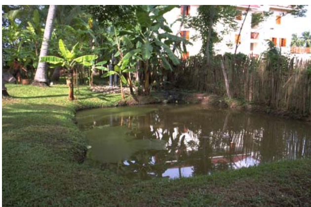
ໜອງເລກທີ ບ້ານ Village ເຈົ້າຂອງໜອງ Propriétaire ເນື້ອທີ່ Surface ທຶນາຂອງນ້ຳ Alimentation hydraulique ກິດຈະກຳ Usages Mare n° 173 ວິຂຸນ VIXUN ທະລັງສີ Thalangsy 191 m 2 B 1