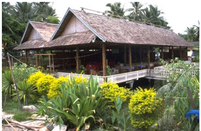
ໜອງເລກທີ Mare n° 42 ບ້ານ Village ມະໂນ MANO ເຈົ້າຂອງໜອງ Propriétaire ບ້ານລາວ Ban Lao ເນື້ອທີ່ Surface 1037 m 2 ທຶນາຂອງນ້ຳ Alimentation hydraulique B ກິດຈະກຳ Usages 1