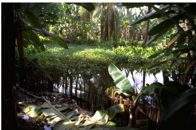
ໜອງເລກທີ ບ້ານ Village ເຈົ້າຂອງໜອງ Propriétaire ເນື້ອທີ່ Surface ທຶນາຂອງນ້ຳ Alimentation hydraulique ກິດຈະກຳ Usages Mare n° 171 ວິຂຸນ VIXUN ຈິນດາວັນ Chindavanh 661 m 2 B 1 - 3