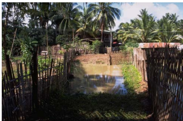
ໜອງເລກທີ Mare n° ບ້ານ Village ເຈົ້າຂອງໜອງ Propriétaire ເນື້ອທີ່ Surface ສົມມາຂອງນ້ຳ Alimentation hydraulique ກິດຈະກຳ Usages 112 ວຽງໄຊ VIENG XAY ຄຳຜອງ Khampong 485 m 2 C 2