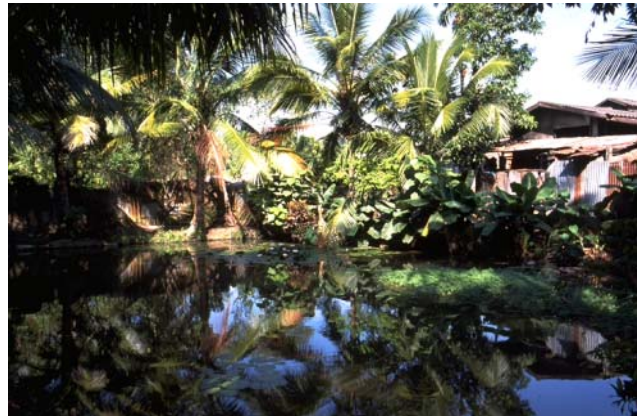
ໜອງເລກທີ ບ້ານ Village ເຈົ້າຂອງໜອງ Propriétaire ເນື້ອທີ່ Surface ທຶນາຂອງນ້ຳ Alimentation hydraulique ກິດຈະກຳ Usages Mare n° 130 ມະໂນ MANO ຈັນມາລີ Chanmaly 422 m 2 A 1 - 2