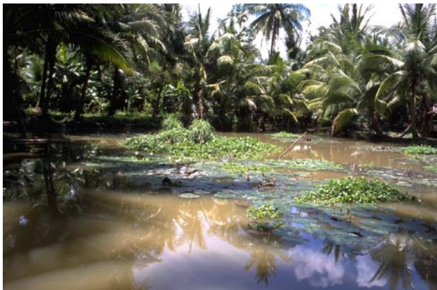
ໜອງເລກທີ Mare n° ບ້ານ Village ເຈົ້າຂອງໜອງ Propriétaire ເນື້ອທີ່ Surface ສົມມາຂອງນ້ຳ Alimentation hydraulique ກິດຈະກຳ Usages 109 ວຽງແກ້ວ VIENG KEO ຜູ Phou 918 m 2 C 1 - 2