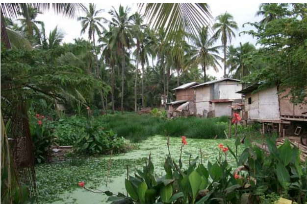
ໜອງເລກທີ ບ້ານ Village ເຈົ້າຂອງໜອງ Propriétaire ເນື້ອທີ່ Surface ທຶນາຂອງນ້ຳ Alimentation hydraulique ກິດຈະກຳ Usages Mare n° 23 ທາດຫຼວງ THAT LUANG ສີສຸມັງ Sisoumang 1330 m 2 A 2