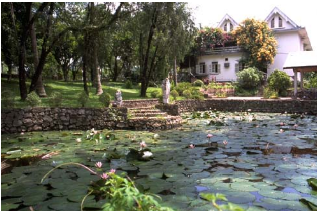
ໜອງເລກທີ ບ້ານ Village ເຈົ້າຂອງໜອງ Propriétaire ເນື້ອທີ່ Surface ທຶນາຂອງນ້ຳ Alimentation hydraulique ກິດຈະກຳ Usages Mare n° 27 ທາດຫຼວງ THAT LUANG ບຸນທ່ຽງ Bounthieng 440 m 2 B 1 - 4