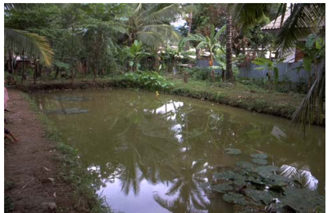
ໜອງເລກທີ ບ້ານ Village ເຈົ້າຂອງໜອງ Propriétaire ເນື້ອທີ່ Surface ທຶນາຂອງນ້ຳ Alimentation hydraulique ກິດຈະກຳ Usages Mare n° 150 ປ້ອງຄຳ PONGKHAM ທອງ Thong 99 m 2 A 1