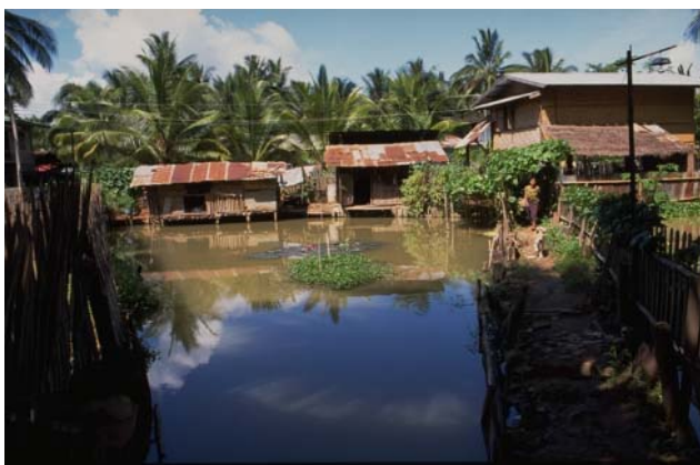
ໜອງເລກທີ Mare n° ບ້ານ Village ເຈົ້າຂອງໜອງ Propriétaire ເນື້ອທີ່ Surface ສົມມາຂອງນ້ຳ Alimentation hydraulique ກິດຈະກຳ Usages 113 ວຽງໄຊ VIENG XAY ພໍ່ເຖົ້າ ສ້າ Phothao cha 485 m 2 C 1 - 2