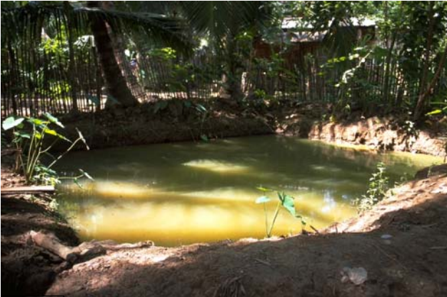
ໜອງເລກທີ ບ້ານ Village ເຈົ້າຂອງໜອງ Propriétaire ເນື້ອທີ່ Surface ທຶນາຂອງນ້ຳ Alimentation hydraulique ກິດຈະກຳ Usages Mare n° 145 ນາວຽງຄຳ NAVIENGKHAM ບຸນທັນ Bounthan 22 m 2 B 1