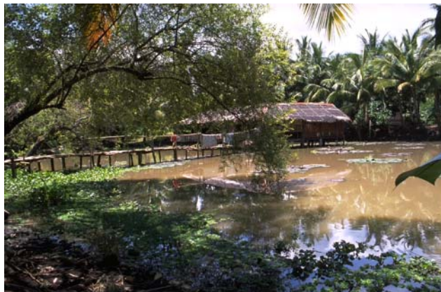
ໜອງເລກທີ Mare n° ບ້ານ Village ເຈົ້າຂອງໜອງ Propriétaire ເນື້ອທີ່ Surface ສົມມາຂອງນ້ຳ Alimentation hydraulique ກິດຈະກຳ Usages 110 ວຽງແກ້ວ VIENG KEO ຜູ Phou 3600 m 2 C 1 - 2