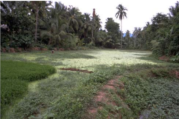
ໜອງເລກທີ Mare n° 39 ບ້ານ Village ມະໂນ MANO ເຈົ້າຂອງໜອງ Propriétaire ສົມມັດ Sommath ເນື້ອທີ່ Surface 2778 m 2 ທຶນາຂອງນ້ຳ Alimentation hydraulique A ກິດຈະກຳ Usages 2