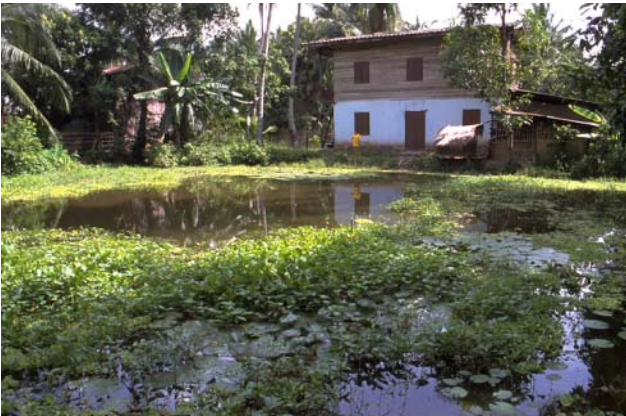
ໜອງເລກທີ ບ້ານ Village ເຈົ້າຂອງໜອງ Propriétaire ເນື້ອທີ່ Surface ທຶນາຂອງນ້ຳ Alimentation hydraulique ກິດຈະກຳ Usages Mare n° 51 ວິຂຸນ VIXUN ສີສຸມັງ Sisoumang 358 m 2 B 1 - 2