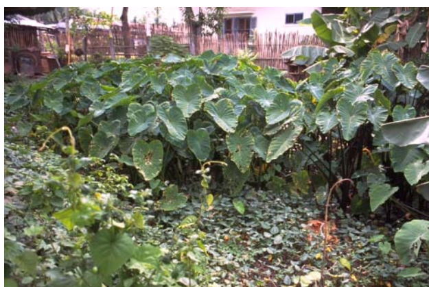
ໜອງເລກທີ ບ້ານ Village ເຈົ້າຂອງໜອງ Propriétaire ເນື້ອທີ່ Surface ທຶນາຂອງນ້ຳ Alimentation hydraulique ກິດຈະກຳ Usages Mare n° 174 ວິຂຸນ VIXUN ວຽງໃໝ່ Viengmay 251 m 2 B 5