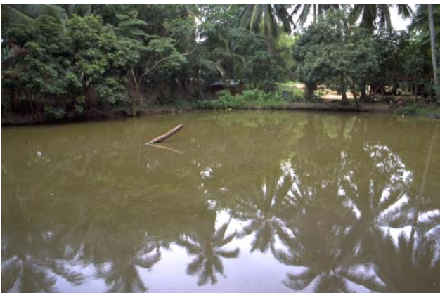
ໜອງເລກທີ Mare n° ບ້ານ Village ເຈົ້າຂອງໜອງ Propriétaire ເນື້ອທີ່ Surface ທຶນາຂອງນ້ຳ Alimentation hydraulique ກິດຈະກຳ Usages 65 ມະໂນ MANO ໜຸ່ມເຜິ້ງ Mopheng 573 m 2 A 5