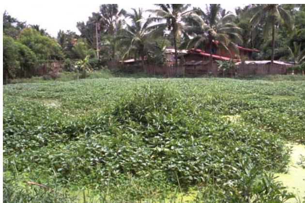
ໜອງເລກທີ ບ້ານ Village ເຈົ້າຂອງໜອງ Propriétaire ເນື້ອທີ່ Surface ທຶນາຂອງນ້ຳ Alimentation hydraulique ກິດຈະກຳ Usages Mare n° 70 ມະໂນ MANO ກົມ Kom 1933 m 2 A 1 - 2