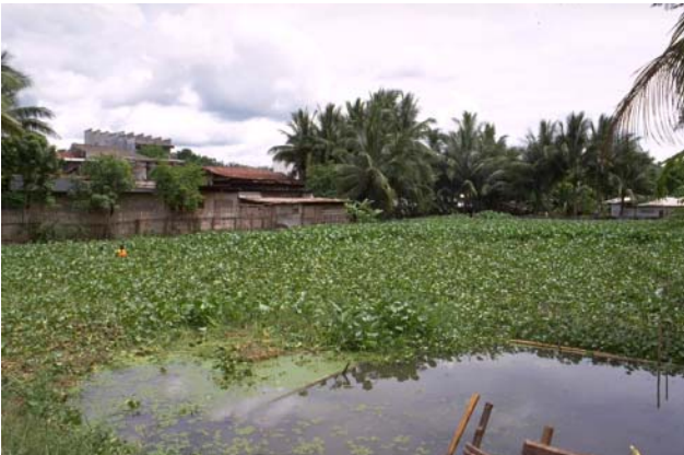
ໜອງເລກທີ ບ້ານ Village ເຈົ້າຂອງໜອງ Propriétaire ເນື້ອທີ່ Surface ທຶນາຂອງນ້ຳ Alimentation hydraulique ກິດຈະກຳ Usages Mare n° 21 ທາດຫຼວງ THAT LUANG ແກ້ວ Keo 4420 m 2 C 1 - 3