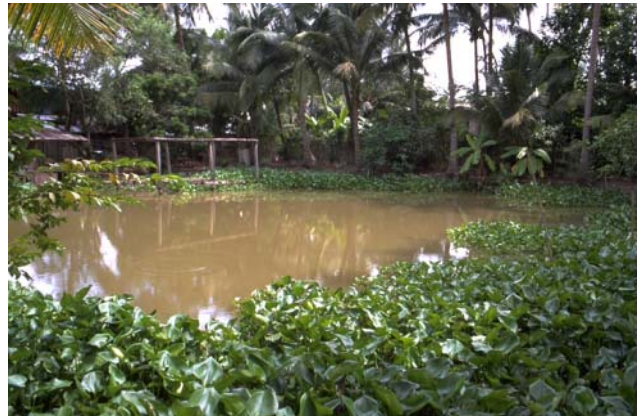
ໜອງເລກທີ ບ້ານ Village ເຈົ້າຂອງໜອງ Propriétaire ເນື້ອທີ່ Surface ທຶນາຂອງນ້ຳ Alimentation hydraulique ກິດຈະກຳ Usages Mare n° 178 ໝື່ນນາ MEUNA ແດງ Deng 400 m 2 B 1 - 3