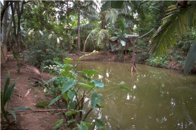
ໜອງເລກທີ Mare n° ບ້ານ Village ເຈົ້າຂອງໜອງ Propriétaire ເນື້ອທີ່ Surface ທຶນາຂອງນ້ຳ Alimentation hydraulique ກິດຈະກຳ Usages 61 ມະໂນ MANO ເຈົ້າເຜິ້ງ Chao Pheng 249 m 2 A 1