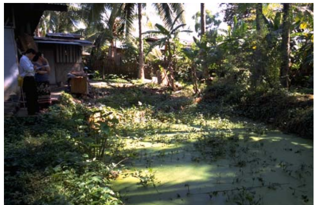
ໜອງເລກທີ ບ້ານ Village ເຈົ້າຂອງໜອງ Propriétaire ເນື້ອທີ່ Surface ທຶນາຂອງນ້ຳ Alimentation hydraulique ກິດຈະກຳ Usages Mare n° 132 ມະໂນ MANO ຈັນທອນ Chanthone 24 m 2 A 5