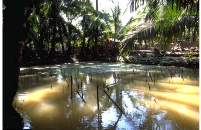
ໜອງເລກທີ ບ້ານ Village ເຈົ້າຂອງໜອງ Propriétaire ເນື້ອທີ່ Surface ທຶນາຂອງນ້ຳ Alimentation hydraulique ກິດຈະກຳ Usages Mare n° 128 ມະໂນ MANO ວົງ Vong 245 m 2 B 1