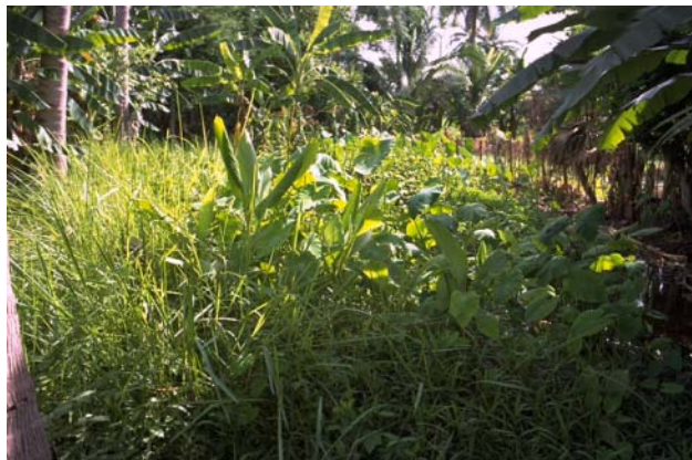
ໜອງເລກທີ ບ້ານ Village ເຈົ້າຂອງໜອງ Propriétaire ເນື້ອທີ່ Surface ທຶນາຂອງນ້ຳ Alimentation hydraulique ກິດຈະກຳ Usages Mare n° 170 ວິຂຸນ VIXUN ຈິນດາວັນ Chindavanh 134 m 2 B 5