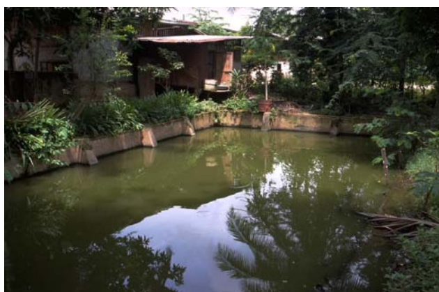
ໜອງເລກທີ ບ້ານ Village ເຈົ້າຂອງໜອງ Propriétaire ເນື້ອທີ່ Surface ທຶນາຂອງນ້ຳ Alimentation hydraulique ກິດຈະກຳ Usages Mare n° 72 ປອງຄຳ PONGKHAM ຄຳ Kham 90 m 2 A 1