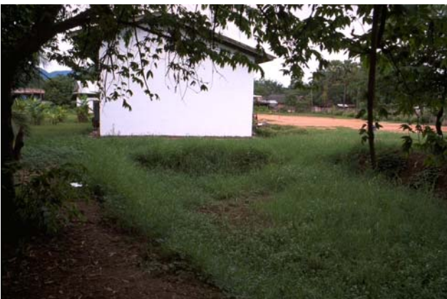
ໜອງເລກທີ Mare n° 41 ບ້ານ Village ທາດຫຼວງ THAT LUANG ເຈົ້າຂອງໜອງ Propriétaire ຮ/ຮ ສີຖານ Ecole Sithane ເນື້ອທີ່ Surface 163 m 2 ທຶນາຂອງນ້ຳ Alimentation hydraulique A ກິດຈະກຳ Usages 5