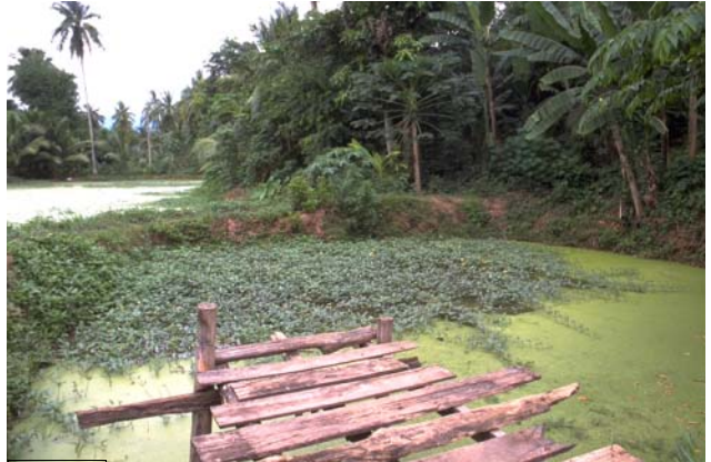
ໜອງເລກທີ Mare n° 38 ບ້ານ Village ມະໂນ MANO ເຈົ້າຂອງໜອງ Propriétaire ສົມມັດ Sommath ເນື້ອທີ່ Surface 143 m 2 ທຶນາຂອງນ້ຳ Alimentation hydraulique A ກິດຈະກຳ Usages 1 - 2