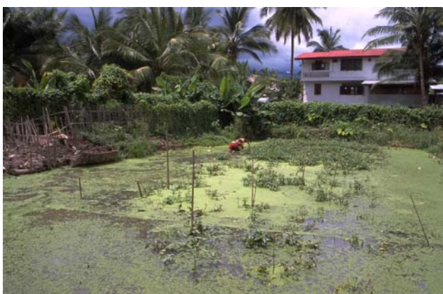
ໜອງເລກທີ ບ້ານ Village ເຈົ້າຂອງໜອງ Propriétaire ເນື້ອທີ່ Surface ທຶນາຂອງນ້ຳ Alimentation hydraulique ກິດຈະກຳ Usages Mare n° 71 ມະໂນ MANO ທອງສະຫວັນ Thongsavan 1664 m 2 A 1 - 2