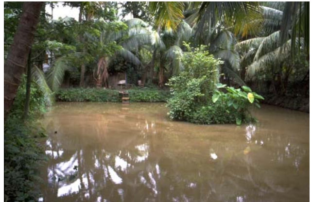
ໜອງເລກທີ Mare n° ບ້ານ Village ເຈົ້າຂອງໜອງ Propriétaire ເນື້ອທີ່ Surface ທຶນາຂອງນ້ຳ Alimentation hydraulique ກິດຈະກຳ Usages 64 ມະໂນ MANO ກູ່ Kou 50 m 2 A 1