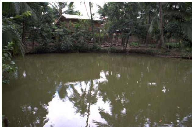
ໜອງເລກທີ ບ້ານ Village ເຈົ້າຂອງໜອງ Propriétaire ເນື້ອທີ່ Surface ທຶນາຂອງນ້ຳ Alimentation hydraulique ກິດຈະກຳ Usages Mare n° 68 ມະໂນ MANO ຊຽງຈັນ Xieng Chanh 619 m 2 A 1