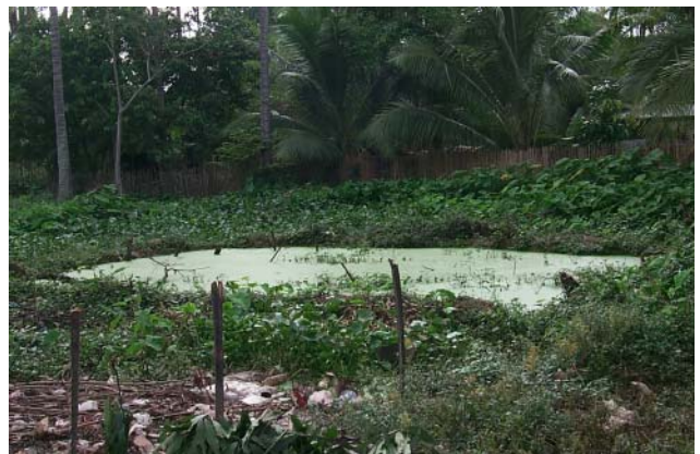
ໜອງເລກທີ ບ້ານ Village ເຈົ້າຂອງໜອງ Propriétaire ເນື້ອທີ່ Surface ທຶນາຂອງນ້ຳ Alimentation hydraulique ກິດຈະກຳ Usages Mare n° 24 ທາດຫຼວງ THAT LUANG ເຈົ້າໂກ້ Chiao Ko 281 m 2 A 5