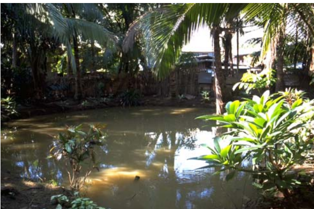
ໜອງເລກທີ ບ້ານ Village ເຈົ້າຂອງໜອງ Propriétaire ເນື້ອທີ່ Surface ທຶນາຂອງນ້ຳ Alimentation hydraulique ກິດຈະກຳ Usages Mare n° 131 ມະໂນ MANO ຈັນມາລີ Chanmaly 106 m 2 A 1 - 2