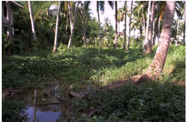
ໜອງເລກທີ ບ້ານ Village ເຈົ້າຂອງໜອງ Propriétaire ເນື້ອທີ່ Surface ທຶນາຂອງນ້ຳ Alimentation hydraulique ກິດຈະກຳ Usages Mare n° 28 ທາດຫຼວງ THAT LUANG ຊິງກວາງ Singkouang 329 m 2 A 5