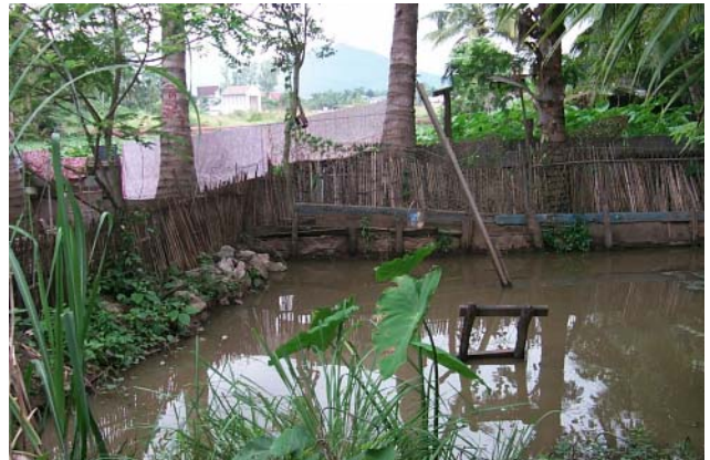
ໜອງເລກທີ ບ້ານ Village ເຈົ້າຂອງໜອງ Propriétaire ເນື້ອທີ່ Surface ທຶນາຂອງນ້ຳ Alimentation hydraulique ກິດຈະກຳ Usages Mare n° 22 ທາດຫຼວງ THAT LUANG ມິງ Ming 65 m 2 A 1