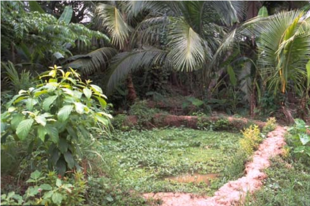
ໜອງເລກທີ Mare n° 37 ບ້ານ Village ມະໂນ MANO ເຈົ້າຂອງໜອງ Propriétaire ສົມມັດ Sommath ເນື້ອທີ່ Surface 100 m 2 ທຶນາຂອງນ້ຳ Alimentation hydraulique A ກິດຈະກຳ Usages 1 - 2