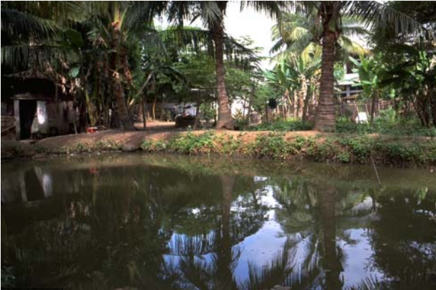
ໜອງເລກທີ ບ້ານ Village ເຈົ້າຂອງໜອງ Propriétaire ເນື້ອທີ່ Surface ທຶນາຂອງນ້ຳ Alimentation hydraulique ກິດຈະກຳ Usages Mare n° 49 ວຽງໄຊ VIENG XAY ໂຮງຮຽນ ຈີນ Ecole chinoise 63 m 2 B 5