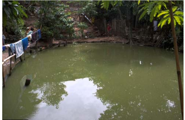
ໜອງເລກທີ ບ້ານ Village ເຈົ້າຂອງໜອງ Propriétaire ເນື້ອທີ່ Surface ທຶນາຂອງນ້ຳ Alimentation hydraulique ກິດຈະກຳ Usages Mare n° 20 ທາດຫຼວງ THAT LUANG ຫຼ້າ La 54 m 2 A 1