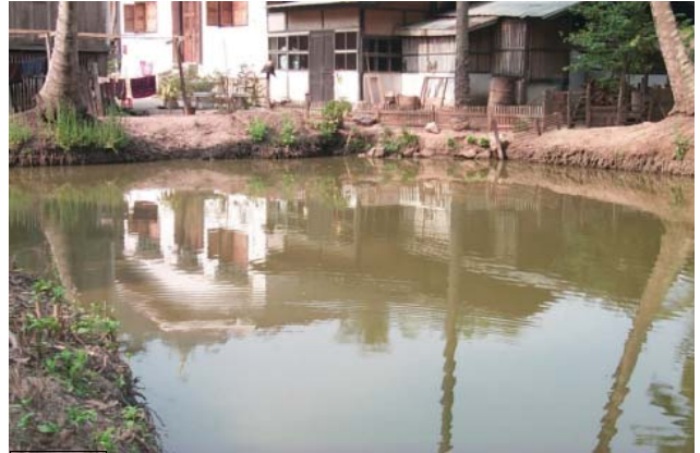
ໜອງເລກທີ ບ້ານ Village ເຈົ້າຂອງໜອງ Propriétaire ເນື້ອທີ່ Surface ທຶນາຂອງນ້ຳ Alimentation hydraulique ກິດຈະກຳ Usages Mare n° 50 ອາຮາມ AHAM ສຸດທິວິງ Soukthivong 103 m 2 B 1 - 4