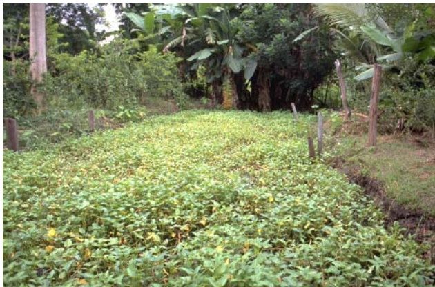
ໜອງເລກທີ ບ້ານ Village ເຈົ້າຂອງໜອງ Propriétaire ເນື້ອທີ່ Surface ທຶນາຂອງນ້ຳ Alimentation hydraulique ກິດຈະກຳ Usages Mare n° 169 ວິຂຸນ VIXUN ອິນທະວົງ Inthavong 163 m 2 B 2