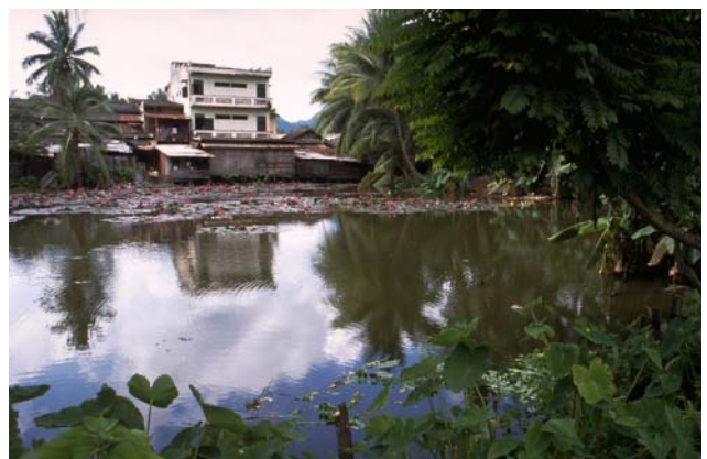
ໜອງເລກທີ ບ້ານ Village ເຈົ້າຂອງໜອງ Propriétaire ເນື້ອທີ່ Surface ທຶນາຂອງນ້ຳ Alimentation hydraulique ກິດຈະກຳ Usages Mare n° 54 ວິຂຸນ VIXUN ອຳພິນ Amphin 1517 m 2 B 1 - 4