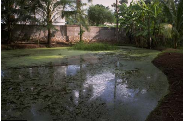
ໜອງເລກທີ ບ້ານ Village ເຈົ້າຂອງໜອງ Propriétaire ເນື້ອທີ່ Surface ທຶນາຂອງນ້ຳ Alimentation hydraulique ກິດຈະກຳ Usages Mare n° 175 ວິຊຸນ VIXUN ທະລັງສີ Thalangsy 273 m 2 B 5