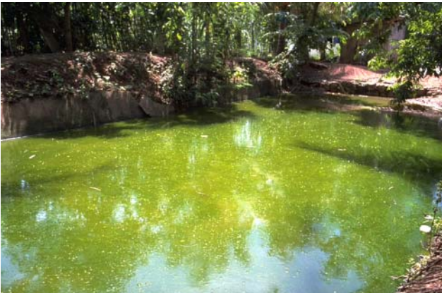
ໜອງເລກທີ ບ້ານ Village ເຈົ້າຂອງໜອງ Propriétaire ເນື້ອທີ່ Surface ທຶນາຂອງນ້ຳ Alimentation hydraulique ກິດຈະກຳ Usages Mare n° 147 ປ້ອງຄຳ PONGKHAM ແສງເພັງຍາ Sengphénya 133 m 2 B 5