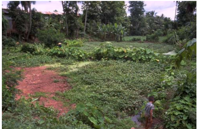
ໜອງເລກທີ Mare n° 40 ບ້ານ Village ມະໂນ MANO ເຈົ້າຂອງໜອງ Propriétaire ລັດ Etat ເນື້ອທີ່ Surface 1935 m 2 ທຶນາຂອງນ້ຳ Alimentation hydraulique A ກິດຈະກຳ Usages 2