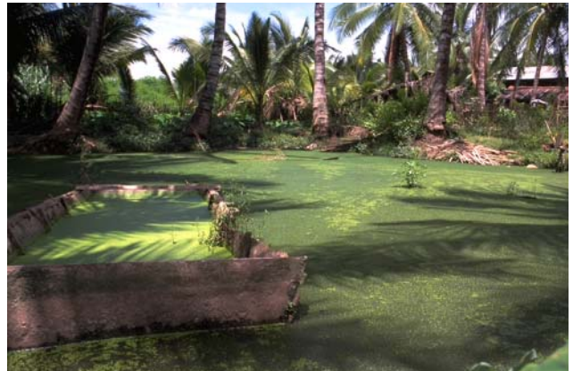
ໜອງເລກທີ ບ້ານ Village ເຈົ້າຂອງໜອງ Propriétaire ເນື້ອທີ່ Surface ທຶນາຂອງນ້ຳ Alimentation hydraulique ກິດຈະກຳ Usages Mare n° 148 ນາວຽງຄຳ NAVIENGKHAM ຫຸມເພັງ Houmpéng 292 m 2 A 5